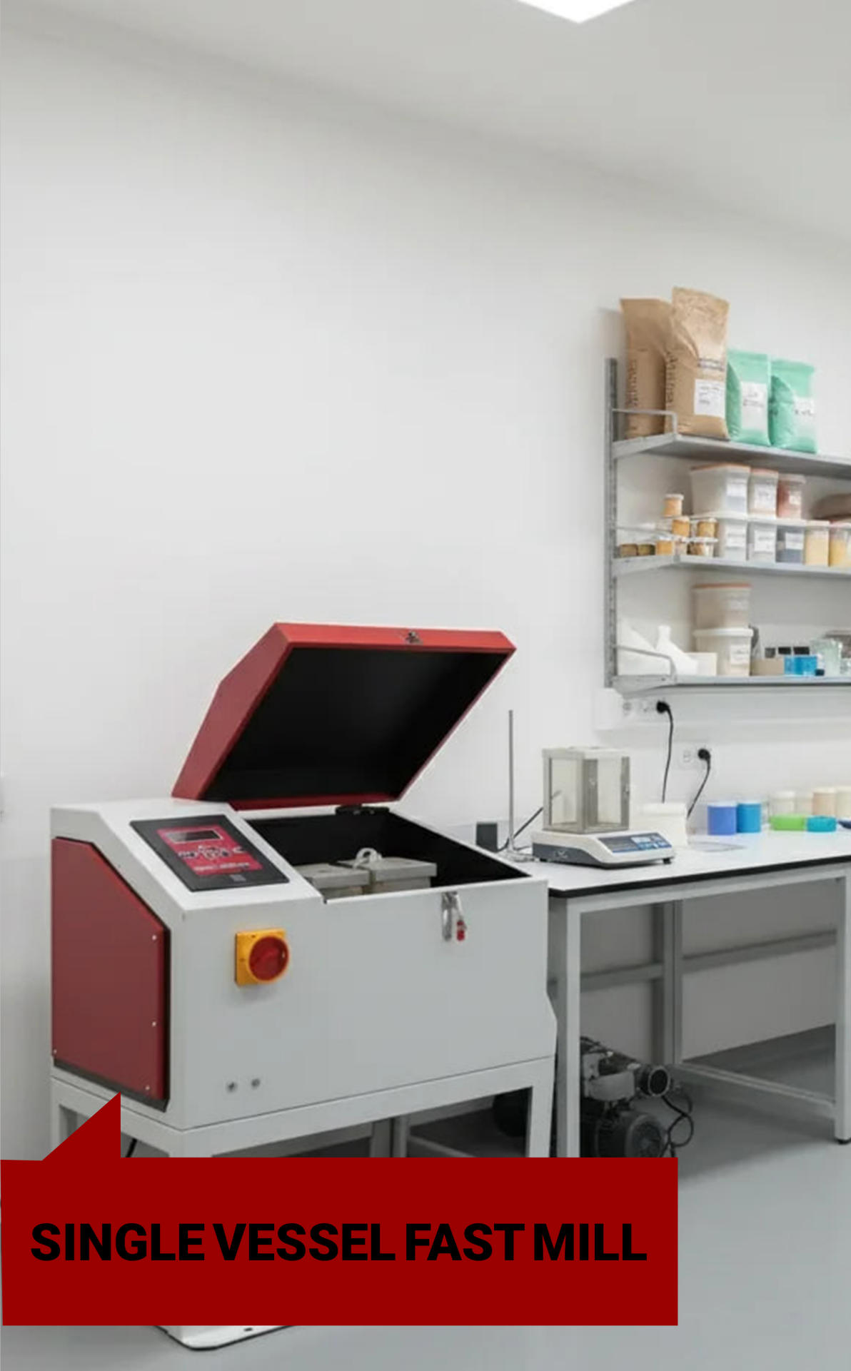
SINGLE VESSEL FAST MILL